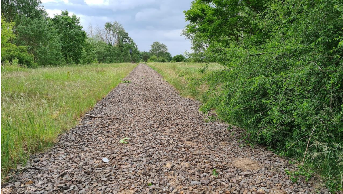
Abbildung 1: Alte Städtebahntrasse Göttiner Bahnhofstraße, Blick Richtung Süd